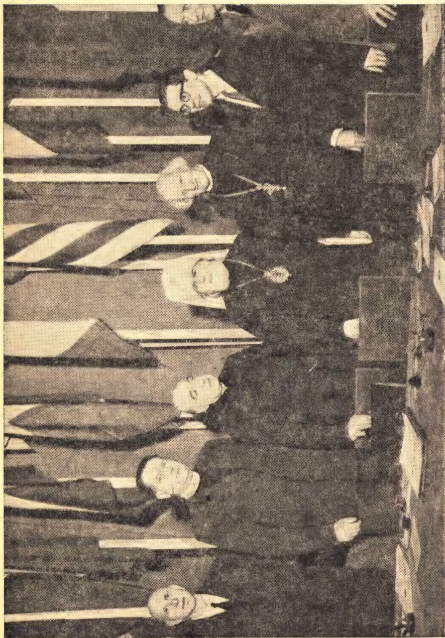
Митрополит Николай на Парижском Конгрессе сторонников мира среди делегатов церквей западных исповеданий (справа от него р.-кат. аббат Булье, слева — настоятель Кентерберийского собора Хьюлетт Джонсон)